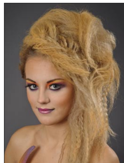
Vítězná práce v kategorii fantazijní líčení