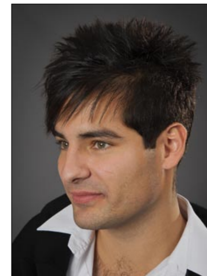
Vítězný účes v pánské kategorii