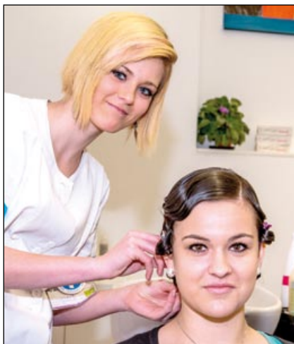
První vytvořené vlny žákyně hned zase rozebrala, aby je před námi vytvořila znovu