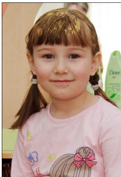
Zlatovláska pózovala před zrcadlem