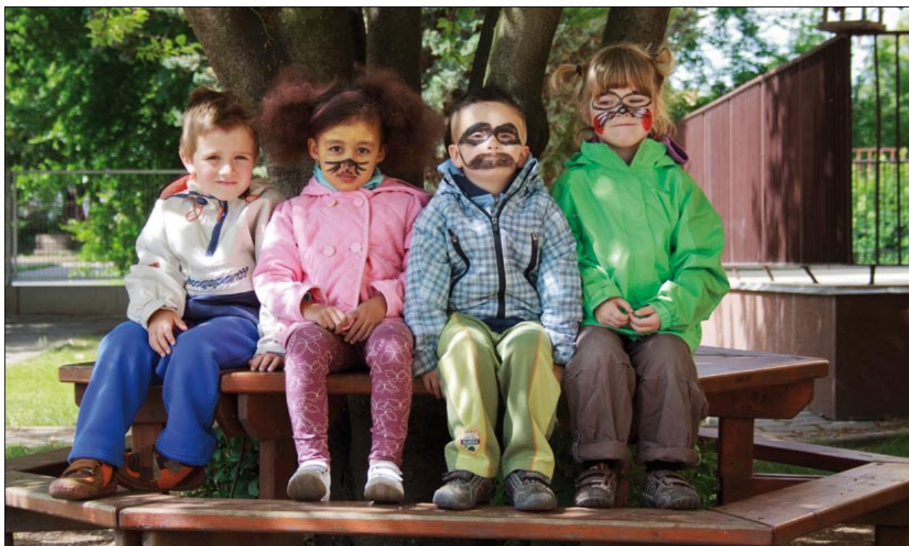
Účesy dotvářejí veselé kresby na dětských tvářičkách

Stejně jako se pětiletá Tereza z rodinného filmu „Kdopak by se vlka bál“ obávala pohádkového vlka, řada dětí předškolního věku má strach z návštěvy kadeřníka. A čím dříve se přesvědčí o tom, že v kadeřnickém salonu na ně nic odstrašujícího nečeká, tím lépe. Tato myšlenka stála na počátku dnes již osmileté spolupráce SOU kadeřnického v Praze 8, Karlínské náměstí, s Mateřskou školou V Zápolí v Praze 4. Společná akce DEN S KADEŘNÍKEM se koná každý rok koncem května a jejím cílem je hravou formou seznámit předškoláky s kadeřnickou profesí, učesat je, případně ostříhat a ještě jim na zahradě předvést aktuální účesovou přehlídku, s níž se žáci 3. ročníků SOU prezentovali po celý školní rok před odbornou i laickou veřejností. Tentokrát se mateřská škola změnila v improvizovaný kadeřnický salon 18. května 2012.