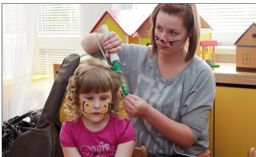
Patříčně vyzdobené byly nejen děti, ale i kadeřnice