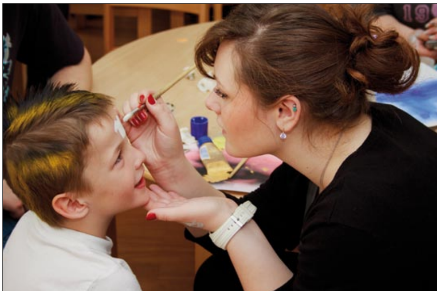
V malířském ateliéru se děti měnily v tygříky, kočky či piráty

Když jsou všechny děti učesané, vydají se společně se svými novými kamarády na oběd. A zatímco malé děti si dopřávají odpolední spánek, velké se připravují na přehlídku. Letos měla název „Včera, dnes a zítra“ a podrobnosti o ní jste si mohli přečíst v Kadeřnické a kosmetické praxi 1/2012. Malé diváky samozřejmě víc zajímají barevné kostýmy a kulisy, než samot-