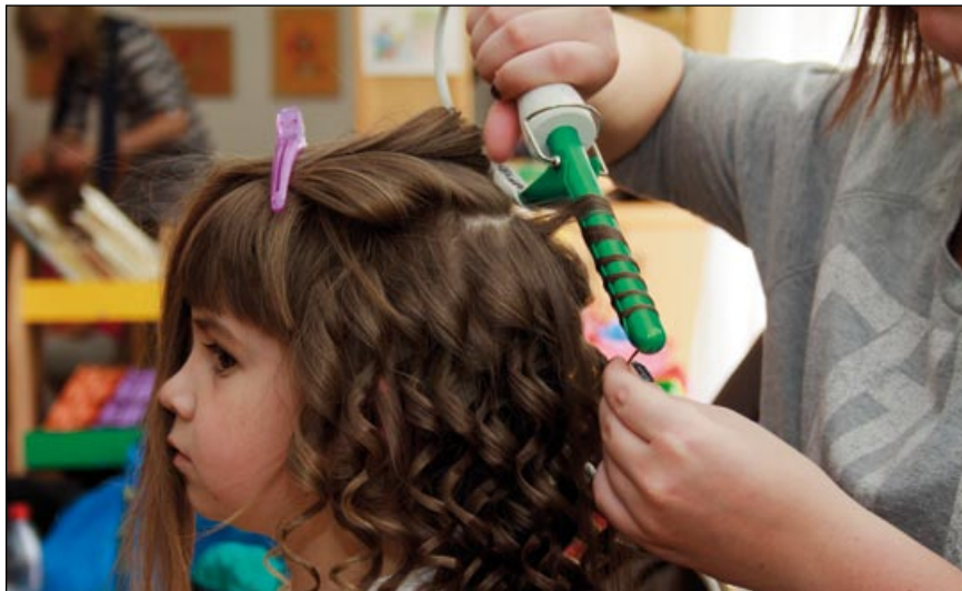
Mezi holčičkami byl velký zájem o princeznovské lokýnky a vlny