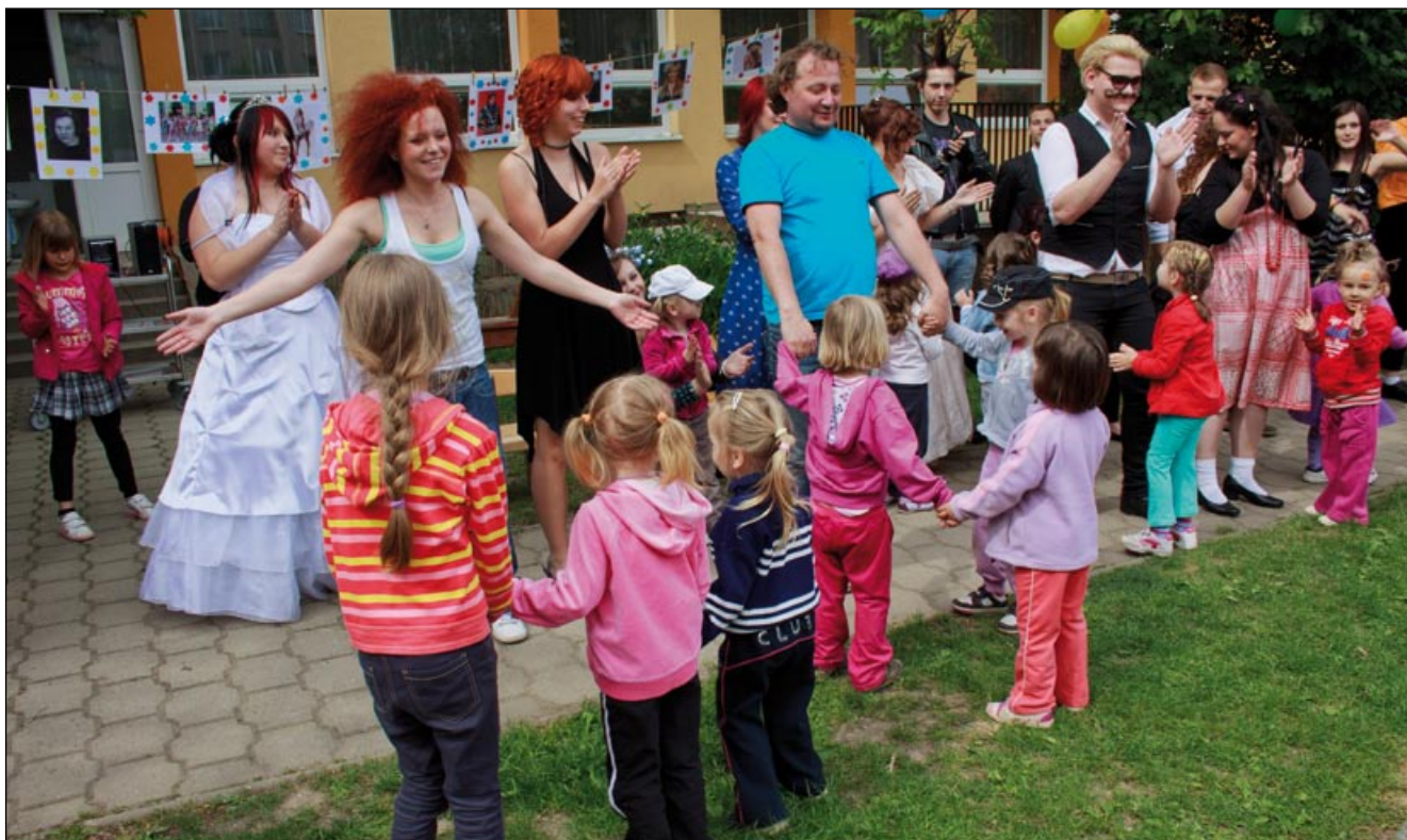
Závěrečného defilé přehlídky se zúčastnily i děti ze školky