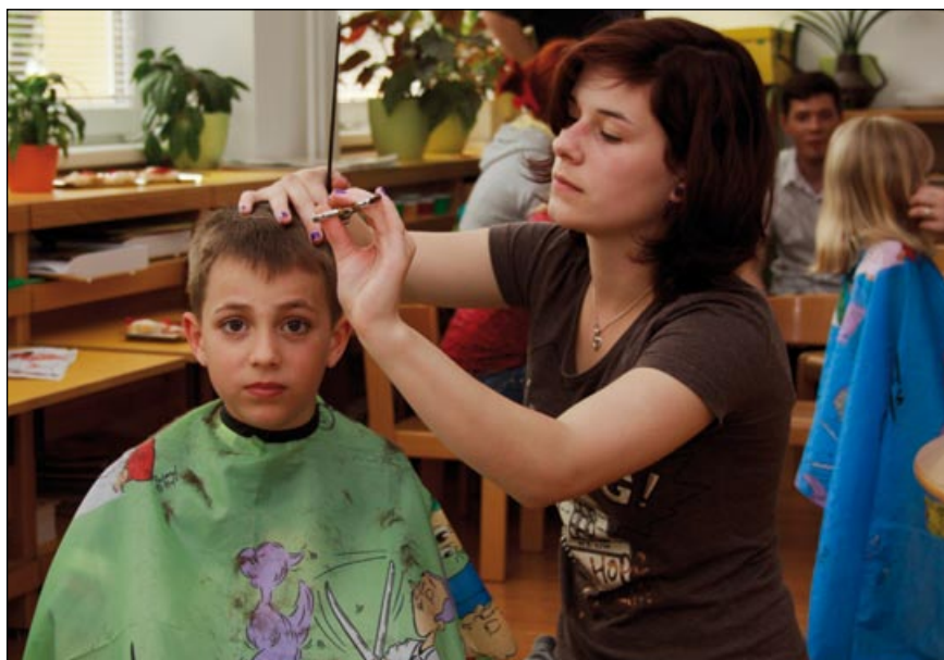
Barevné dětské pláštěnky pomohou oživit atmosféru v salonu