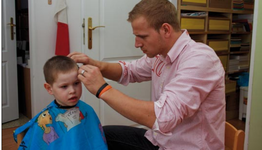
Páni kluci na nějaký centimetr vlasů nehleděli